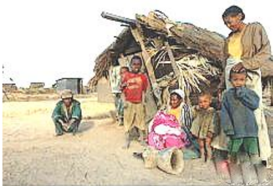
Masure où vivent les familles pauvres

Le Centre accueille 50 jeunes vivant dans les rues, sans abri et sans famille. Au cours de rondes de nuit, les éducateurs du Centre, eux-mêmes anciens enfants des rues, leur proposent de passer quelques nuits au gîte où ils peuvent se laver et se nourrir. Puis, s'ils le désirent, ils intègrent le Centre où une formation leur est proposée.