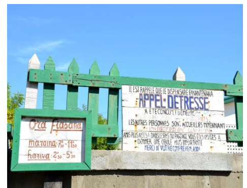
Pancarte à l'entrée du dispensaire