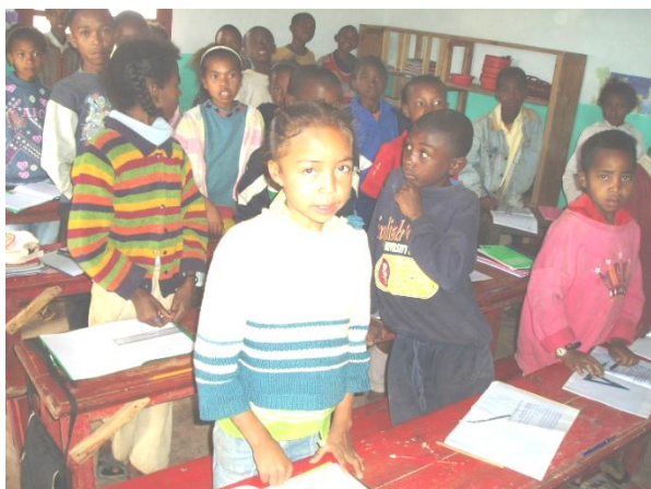
Alphabétisation pour 100 jeunes déscolarisés Issus des quartiers pauvres