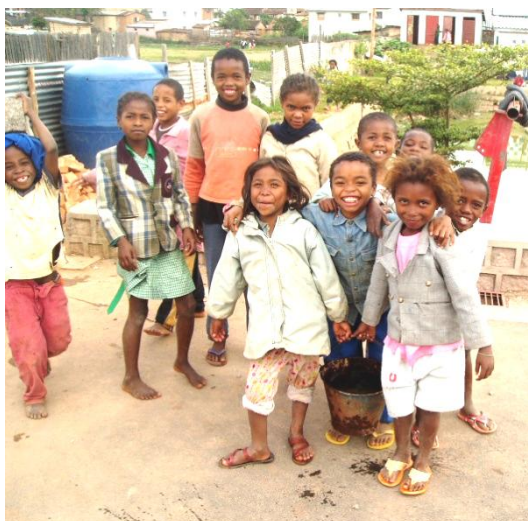
Nourriture, soins et éducation sont proposés aux jeunes enfants analphabètes des quartiers pauvres