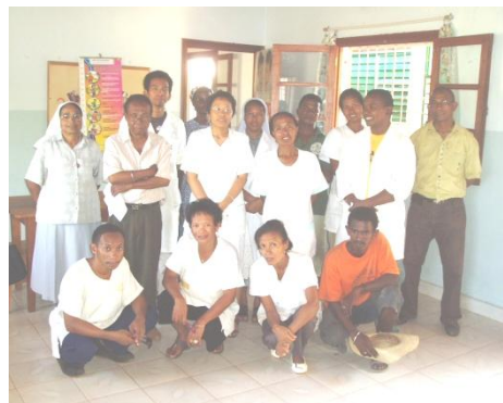
Personnel du dispensaire