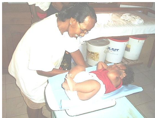
Pesée au Centre Nutritionnel