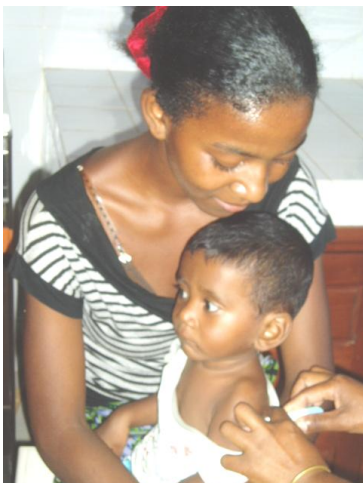
Service de vaccinations