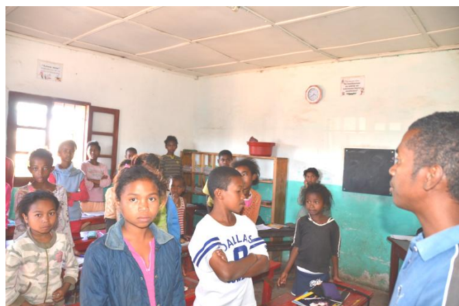
Education et formation générale pour 36 jeunes Ils apprennent aussi à vivre ensemble