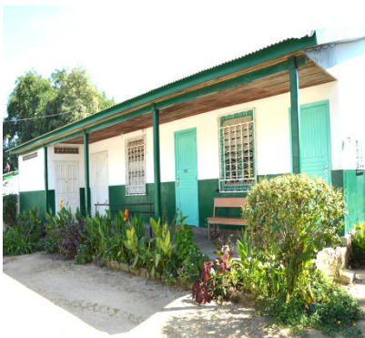
Centre Nutritionnel de Morondava