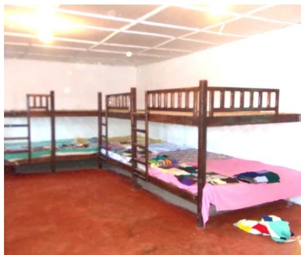
Les jeunes de la rue passent quelques nuits au gîte avant d'intégrer le Centre, si ils le désirent