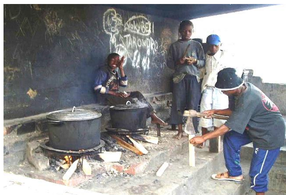
Préparation du repas au centre d'accueil